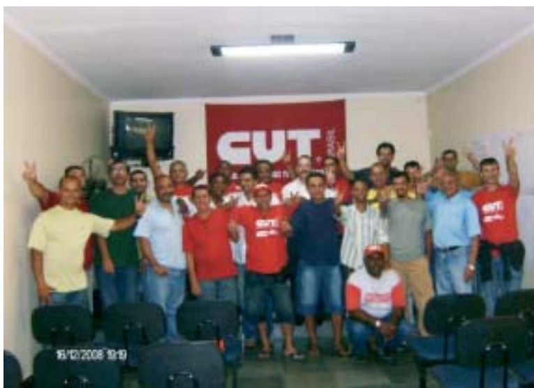
Chapa 2 representa renovação para os metalúrgicos de São José dos Campos