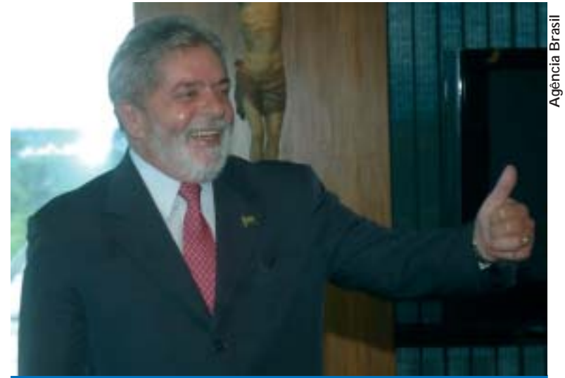
Aprovação de Lula mostra a confiança do povo do combate à crise econômica

A pesquisa CNT/Sensus divulgada na semana passada mostra que 84% da população aprova o desempenho do presidente Lula. É a melhor avaliação já atingida por um presidente da República.