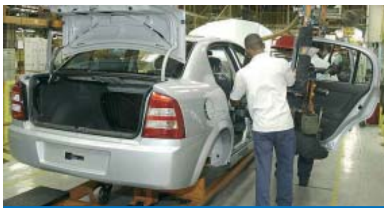
GM coloca a culpa na crise e o Semlutas concorda com a empresa...

Não dava para perceber então que havia algo de errado?