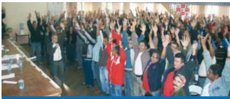
Metalúrgicos reunidos no ABC aprovam a pauta da Campanha Salarial 2009

Com a presença de mais de 300 metalúrgicos foram aprovadas as seguintes ban-