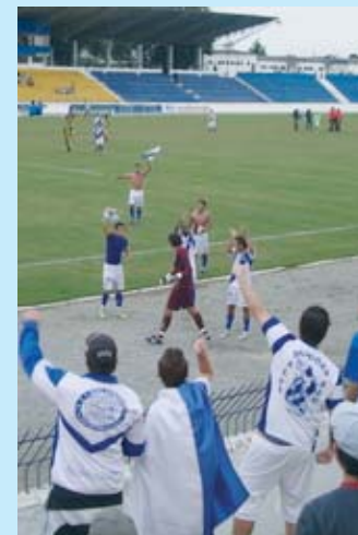
Jogadores e torcida do Taubaté comemoram a vitória em São José dos Campos

O Taubaté voltou a marcar gols na Série B do Campeonato Paulista. Após duas partidas sem marcar, o Alvi Azul fez dois e venceu no sábado, 27, o Joseense por 2 a 0 no estádio Martins Pereira.