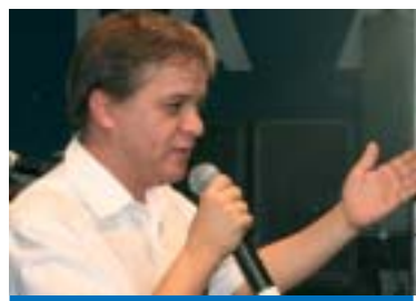
Deputado Carlinhos Almeida

Lideranças políticas e sindicais do Vale do Paraíba estiveram reunidas na quinta-feira, dia 25, em Jacareí para comemorar os 46 anos de idade do deputado estadual Carlinhos Almeida.