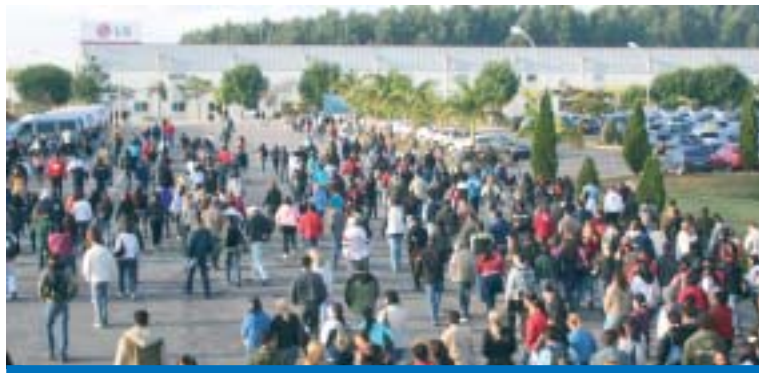
A participação dos trabalhadores é decisiva para o futuro da categoria

do Sindicato deve participar das plenárias de seu grupo ou empresa e dar a sua colaboração para o 4º Con-