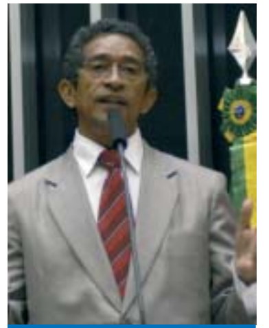
Deputado Vicentinho (PT/SP)

Depois de aprovado na Comissão Especial no próximo dia 30, o tempo necessário para que o projeto vá a plenário vai depender da prioridade que o presiden-