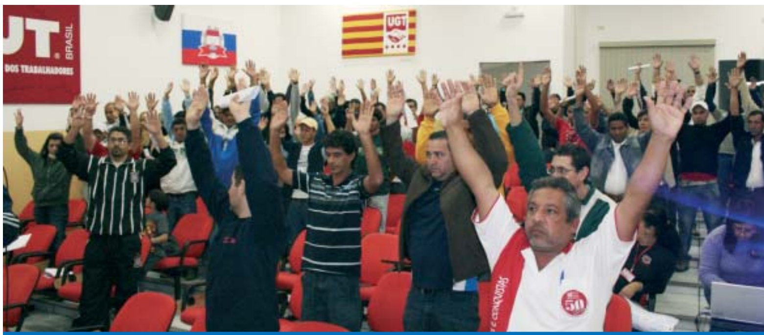
Os trabalhadores nas Autopeças elegeram seus delegados ao Congresso e aprovaram as propostas elaboradas pelos Grupos de Trabalho durante a plenária

No último domingo, dia 28, os trabalhadores nas empresas de Autopeças elegeram seus delegados ao 4º Con-