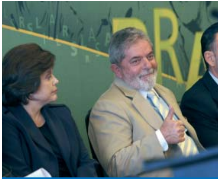
Lula e Dilma Rousseff durante o anúncio das medidas nesta segunda-feira, 29

Para o presidente Lula, "a cadeia de produção de veículos emprega muita mão de