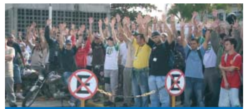
Unidade em semana decisiva garante PLR aos trabalhadores na Pelzer

Parabéns a todos os trabalhadores na Pelzer pela Unidade e luta pela PLR.