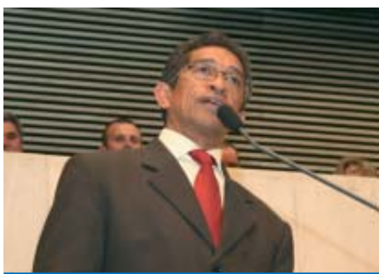
Deputado Federal Vicente (PT) discursa na tribuna