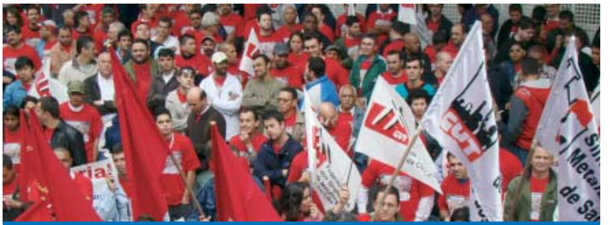
Está chegando a hora dos trabalhadores demonstrarem disposição de luta e unidade na Campanha Salarial

A FEM/CUT-SP lembra que todas as alterações, ajustes e a inclusão de novos direitos em todas as rodadas com as bancadas patronais serão submetidos no término das negociações à apreciação nos trabalhadores nas bases.