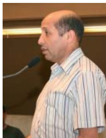
Vereador Alfredinho (PT) de São Paulo