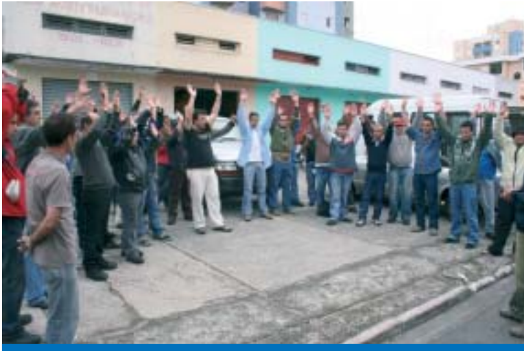
Trabalhadores em greve na Equitextil por melhores condições de trabalho

Os trabalhadores na Equitextil continuam em greve por tempo indeterminado devido ao impasse nas negociações que envolvem a PLR 2009 e uma extensa pauta de negociações.