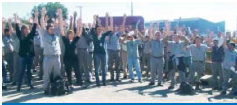
Unidade e mobilização garantiu a conquista dos trabalhadores na Usiminas

Pela proposta também fica garantido um período de estabilidade de 45 dias a todos