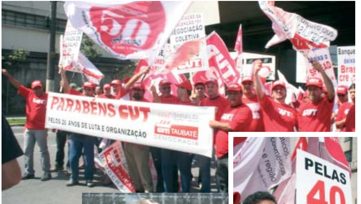
Os Metalúrgicos de Taubaté na passeata, o presidente Nacional da CUT, Artur Henrique e o Deputado Federal Vicentinho (PT)

Relator do projeto das 40 horas semanais no Congresso, Vicentinho destacou a