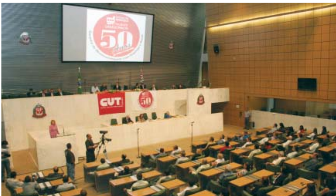
Plenário da Assembléia Legislativa foi lotado por trabalhadores, dirigentes sindicais, funcionários do Sindicato e familiares

"Outra grande virtude deste Sindicato é a capacidade de diálogo, e através dela