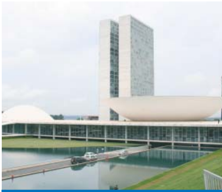
A CUT vai visitar os gabinetes de todos os deputados no Congresso

A redução da jornada de trabalho sem redução de salários, além de gerar mais de 2 milhões de empregos, como demonstram os estu-