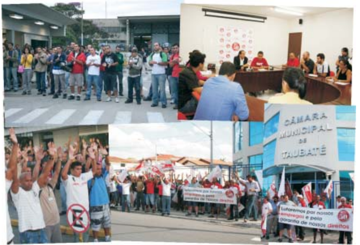
A unidade dos trabalhadores na MP Plastics foi mais uma vez fundamental nesta luta pela defesa de seus empregos

A decisão do STJ faz com que a pendência entre a MP Plastics e a Indarú seja agora discutida no mérito dos