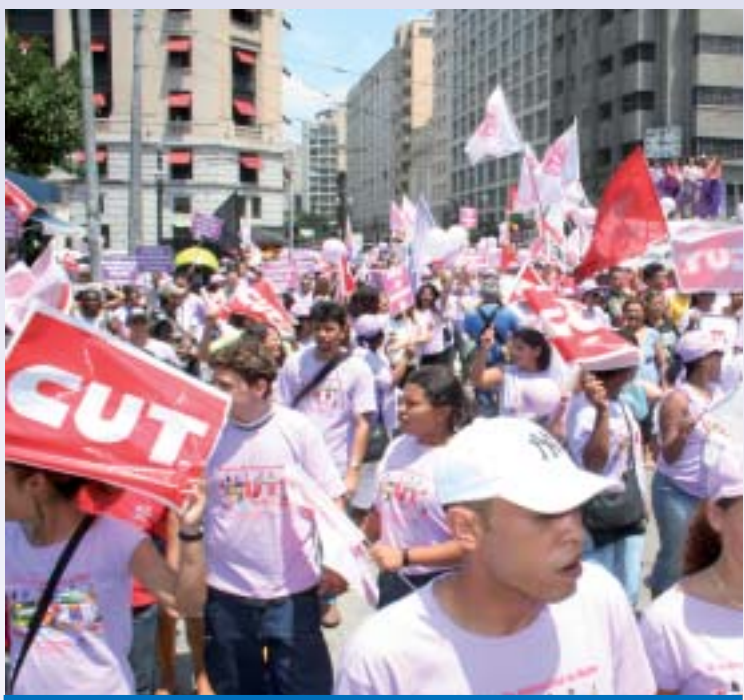
A Marcha Mundial das Mulheres 2010 percorrerá 10 cidades paulistas

minhantes acamparão em dez cidades paulistas: Valinhos, Vinhedo, Louveira, Jundiaí, Várzea, Cajamar, Jordânia, Perus e Osasco.