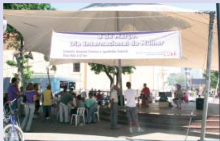
Mais uma vez a CUT Vale comemora o Dia da Mulher com a comunidade

A CUT Vale do Paraíba e seus sindicatos filiados estarão comemorando o Dia Internacional da Mulher com o tradicional ato público que será realizado na Praça Dom Epaminondas no Centro de Taubaté na próxima sexta-feira, dia 5 de março, no horário das 9h às 12h. O evento contará com a presença de lideranças sindicais e políti-