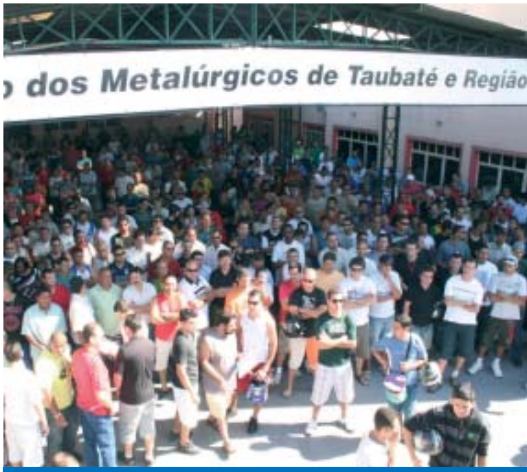
Trabalhadores exercem a democracia na luta por seus direitos

No próximo domingo, dia 11 de abril, terá início o processo eleitoral 2010 do Sindicato dos Metalúrgicos de Taubaté e Região com a realização da Assembléia Geral para votação do calendário eleitoral e da Comissão que conduzirá o pleito.