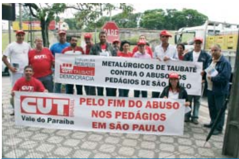
Panfleto sobre o abuso nos pedágios foi distribuído para a população

A CUT (Central Única dos Trabalhadores) realizou na quinta-feira, dia 1º, uma mobilização em diversas rodovias de São Paulo contra o abuso cometido pelo Governo Serra nos pedágios em todo o Estado. Segundo estudo realizado pela bancada do PT na Assembleia Legislativa, no Estado existem 227 praças de