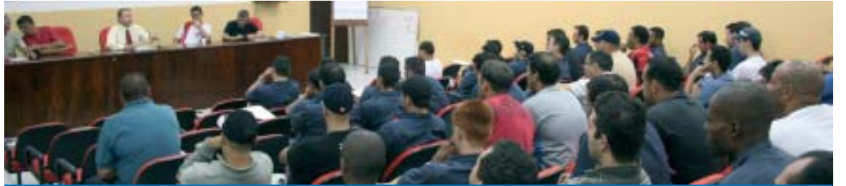
Trabalhadores aprovaram paralisação de 24 horas (Acima). Plenária reafirma unidade dos metalúrgicos por PLR (Abaixo)

onde receberam todas as informações sobre os encaminhamentos legais do processo na Justiça.