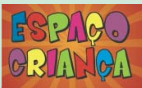
No ano passado as crianças se divertiram bastante com a pintura de rosto entre outras brincadeiras. O Espaço Criança será montado no estacionamento da Câmara Municipal.

O 1º de Maio também contará com um espaço especial para as crianças. O “Espaço Criança” terá atrações como como mágico, malabaristas, palhaços e perna de pau, que estarão circulando pela Avenida do Povo, além de estandes com pintura de rosto, e escultura de balões entre outras atrações.