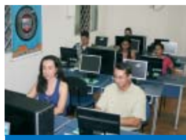
Trabalhadores na Daruma estudam no polo UNIMES Virtual

A UNIMES Virtual dispõe de cursos como Tecnólogo Superior em Gestão de Pe-