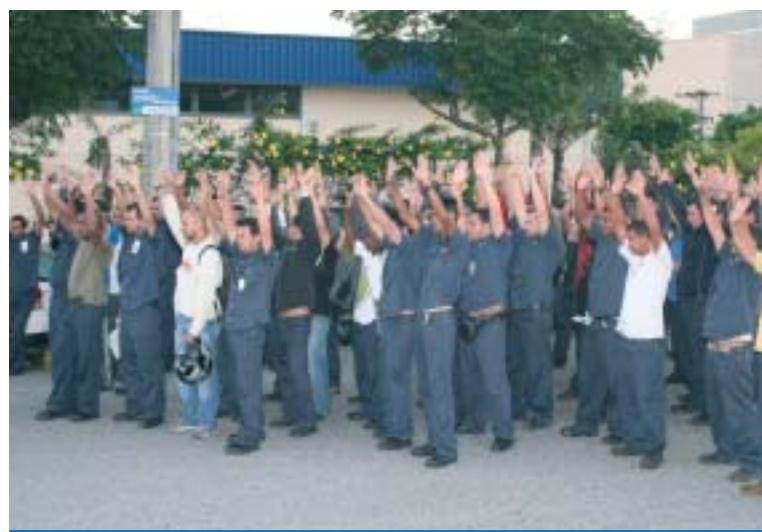
Trabalhadores na Usiminas conquistam Comitê Sindical de Empresa

Assim como as Comissões de Fábrica e as Cipas, o CSE é fundamental para fortalecer as lutas por PLR e rea-