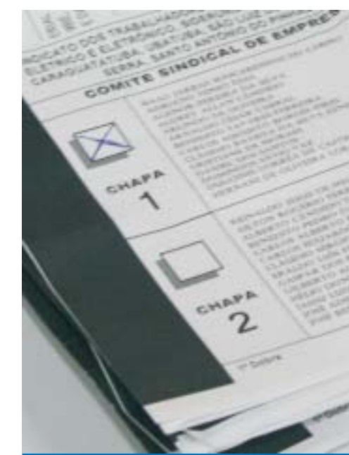
Trabalhador marcou Chapa 1 sem dúvida

A categoria referendou a CUT como a legítima representante dos trabalhadores no CSE na Volkswagen graças ao trabalho de valorização dos salários dos trabalhadores, de constante valorização das PLRs, da conquista de investimentos para a planta de Taubaté, de geração de empregos e de renda para a cidade e para o Vale do Paraíba. O trabalhador mostrou na urna que sabe o que é seriedade.