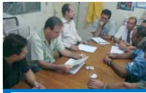
Chapas concorrentes se reúnem antes da eleição

Foram realizadas diversas reuniões entre os representantes das duas chapas concorrentes ao CSE Volkswagen antes da eleição, para que todas as etapas fossem cumpridas com o acompanhamento necessário das duas chapas e que todos os procedimentos acontecessem de forma transparente.