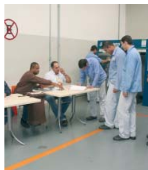
Trabalhadores exerceram seu direito ao voto

O aumento do número de votantes mostra que a categoria está cada vez mais consciente de que é importante manter a unidade na luta, com um Sindicato que luta de verdade pelos trabalhadores e que também atua pela qualidade de vida do povo de Taubaté e Região.