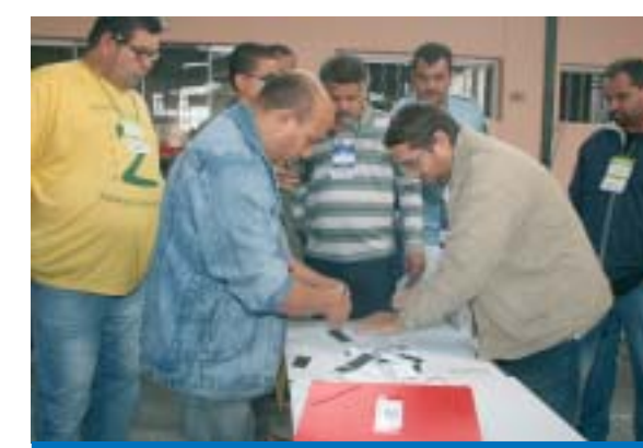
Mesários das chapas concorrentes abrem a primeira urna durante a apuração dos votos.

A apuração dos votos aconteceu na manhã do sábado, 15, na sede do Sin-