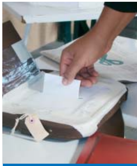
2º Turno será nos dias 09, 10 e 11 de junho

Vamos manter a unidade demonstrada no 1º turno e mais uma vez comparecer às urnas para completar este processo eleitoral democrático e transparente.