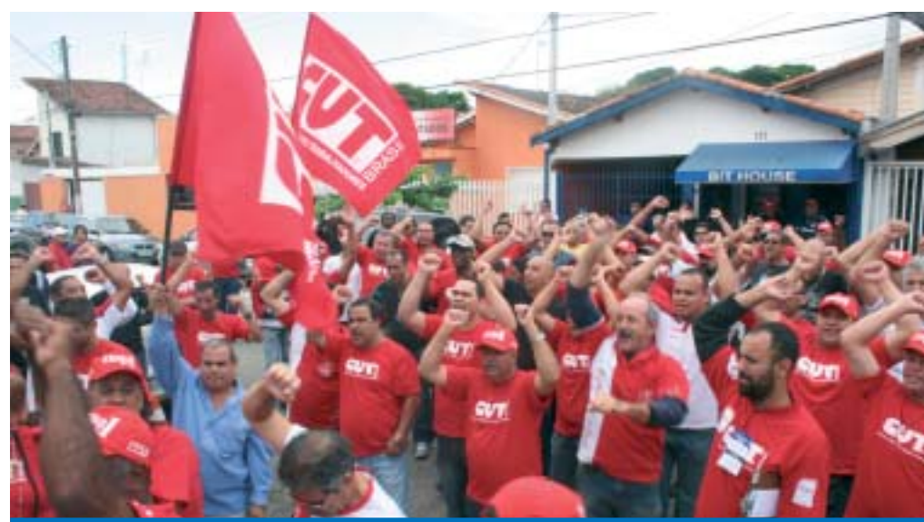
Dirigentes, trabalhadores e militantes comemoram a vitória da Chapa 1 da CUT na eleição sindical

A Chapa 1 da CUT venceu a eleição sindical 2010 em todos os Comitês Sindicais de Empresa com 88% dos votos válidos dos trabalhadores, com um total de 8.384 votos. A chapa da oposição teve 1.228 votos, o que representa 11,86% dos votos.