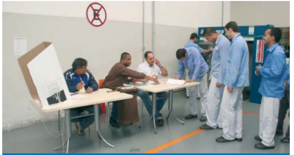
Os Metalúrgicos de Taubaté voltam às urnas para o 2º Turno da Eleição Sindical 2010 nos dias 09, 10 e 11 de Junho

O Ministro elogiou o modelo sindical dos Comitês Sindicais de Empresa, que segundo ele representa um significativo aperfeiçoamento das relações de trabalho.