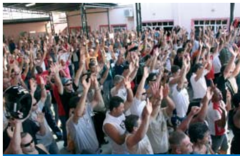
Metalúrgicos da CUT iniciam mais uma luta com a Campanha Salarial 2010

A apuração do 2º Turno do Processo Eleitoral dos Metalúrgicos de Taubaté e Região será realizada no sábado, dia 12, a partir das 7h, na sede do Sindicato, que fica na Rua Urupês, 98, no bairro Chácara do Visconde.