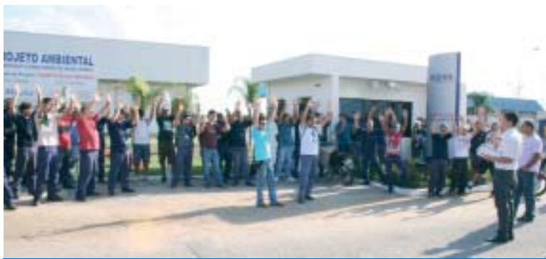
Para o presidente Isaac, os trabalhadores tiveram uma grande conquista

aprovada pelos trabalhadores a implantação da jornada 6 x 2 na empresa, o que possibilita a abertura de postos de trabalho na empresa e a redução da jornada de trabalho. A mudança da jornada também viabilizou o pagamento de um abono aos trabalhadores.