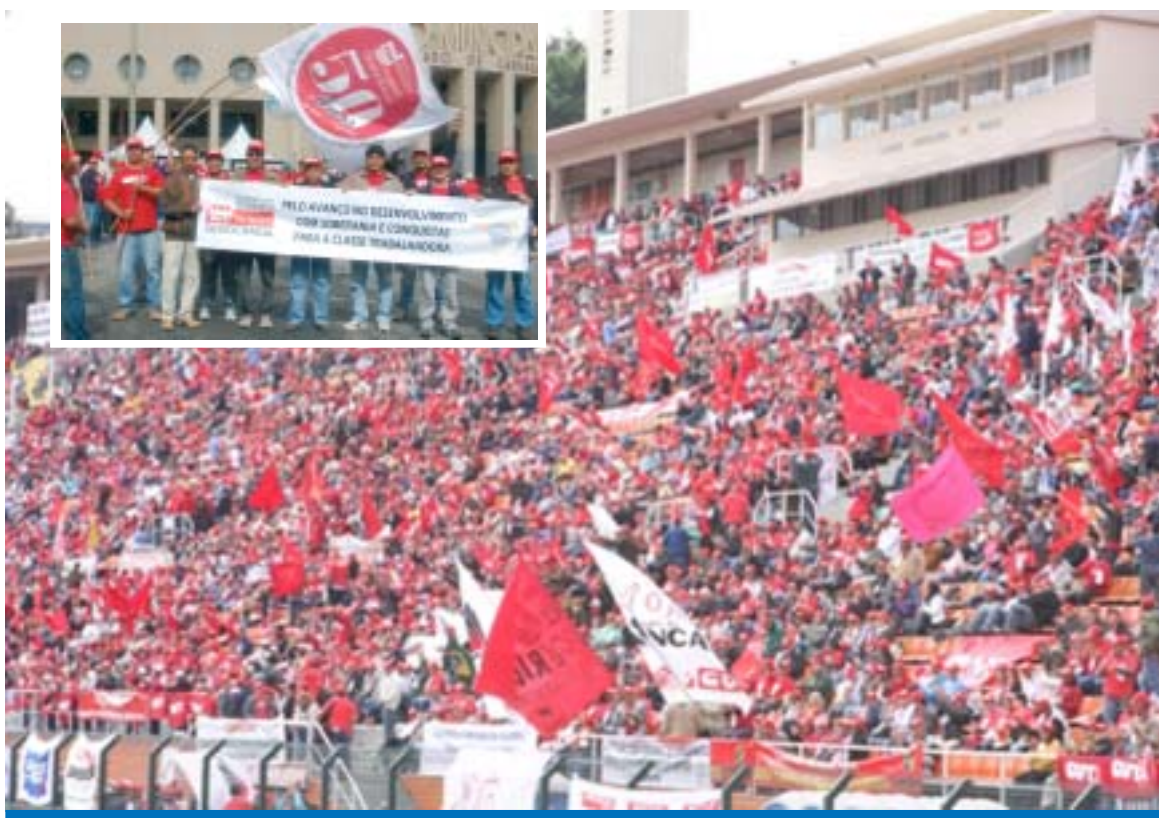
A militância da CUT lotou as arquibancadas do Pacaembu, no destaque os metalúrgicos de Taubaté marcam presença

Para o presidente da CUT, Artur Henrique, a união das centrais é histórica. "Agora os trabalhadores participam e são ouvidos pelo Governo. Houve conquistas nos últimos oito