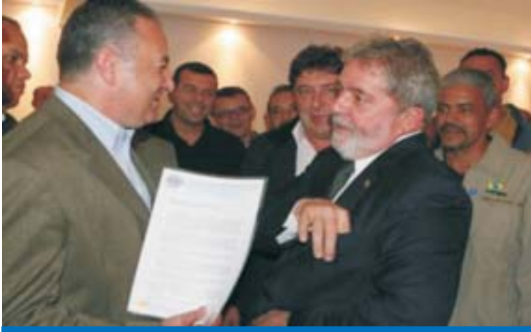
Lula recebe a pauta da CUT reivindicando os 7,7% entre outras questões

O presidente da República, Luiz Inácio Lula da Silva, sancionou no dia 15 de junho o reajuste de 7,72% aos aposentados e pensionistas que recebem mais de um salário mínimo e vetou o fim do fa-