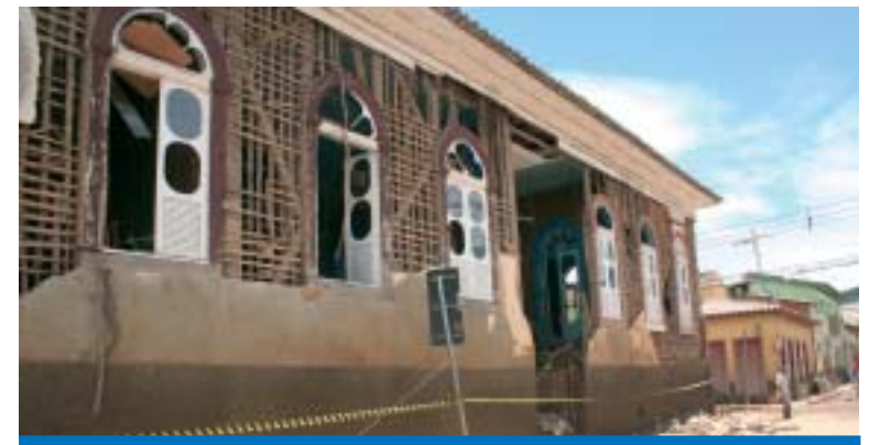
Entidade ajuda na reconstrução do patrimônio de São Luiz do Paraitinga

O Asilo conta com 10 apartamentos que abrigam cerca de 16 idosos da cidade de São Luiz atendendo com alimentação, dormitórios, ba-