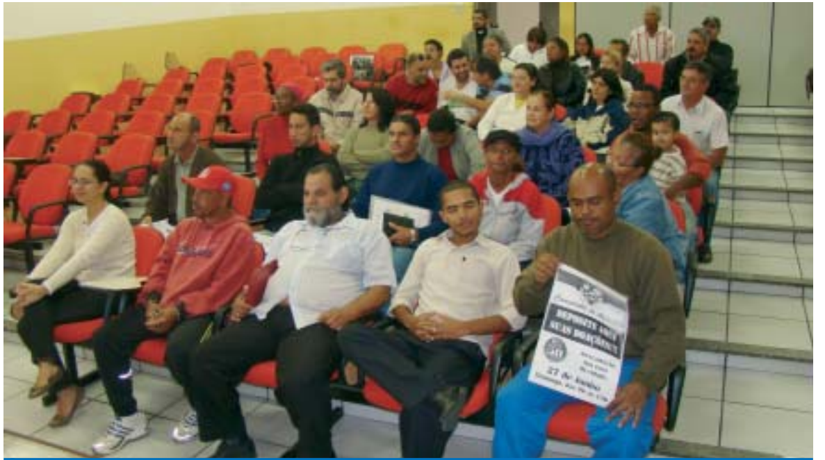
Reunião da Campanha do Agasalho realizada no dia 16 de junho com as entidades assistenciais na sede do Sindicato

Os agasalhos arrecadados serão distribuídos entre as entidades assistenciais participantes da Campanha na segunda-feira, dia 28, na sede do