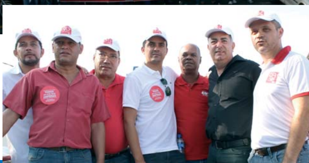
Acima, o presidente Isaac fala aos trabalhadores. Logo abaixo junto com as lideranças políticas e sindicais e com a delegação de Taubaté.