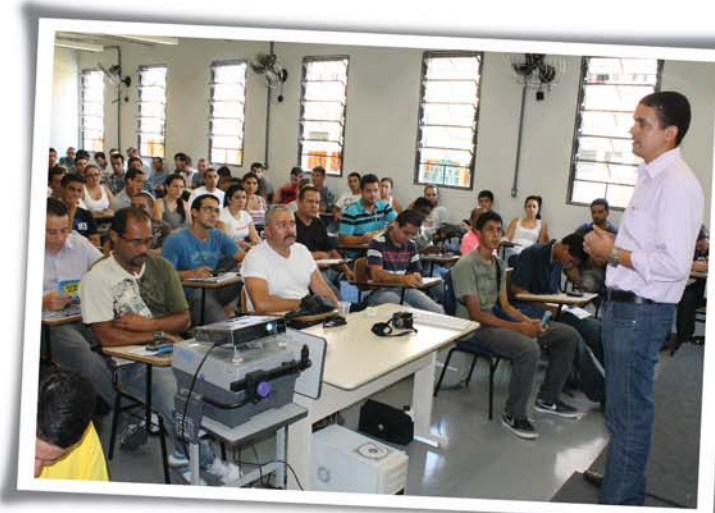
Presidente Isaac conversa com trabalhadores na Ford durante integração no último dia 09